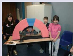
Voici comment réaliser une clé de voute !